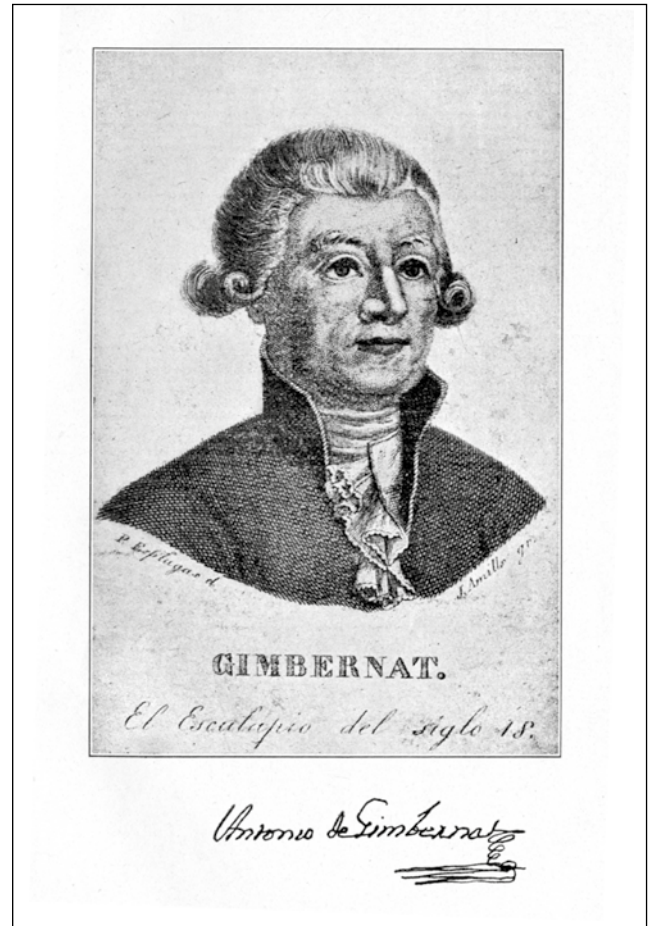
Figura 5. Representación de Antonio Gimbernat.

Madrid un nuevo colegio de cirugía. Este es creado en 1780 y brilla por la excelente docencia así como por sus modelos de ceroplástica que han sido considerados como de los mejores de su tiempo. Además,