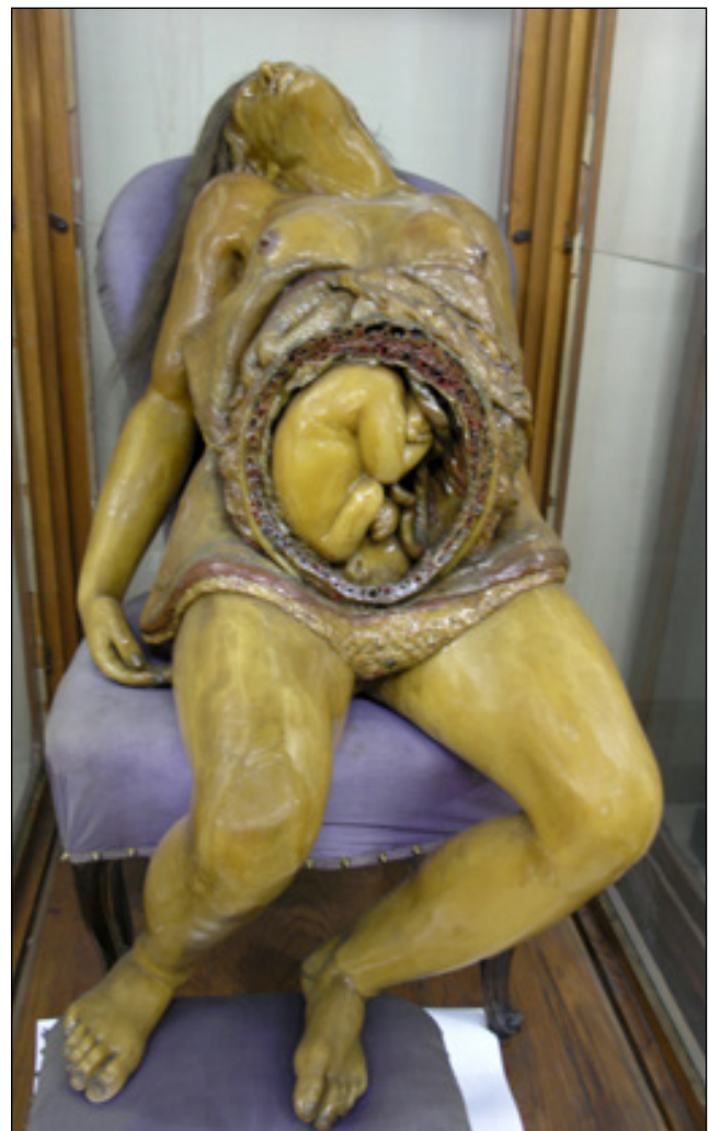
Figura 3. Modelo anatómico de la parturienta. Museo Anatómico “Javier Puerta”. Facultad de Medicina, Universidad Complutense de Madrid.

Los requisitos que se marcaron para la aceptación de nuevos alumnos fueron que tuviesen conocimientos de latín, física, algebra, geometría y lógica; además