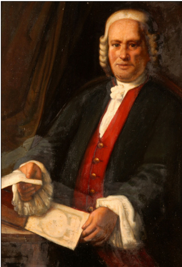
Figura 4. Retrato de Pedro Virgili.

Fue una de las piezas claves en el florecer de esta cirugía ilustrada y, a pesar de que sus restos mortales se desprestigiaron y se desconozca su paradero, su vida y sus obras serán inmortales (14) (Fig. 4).