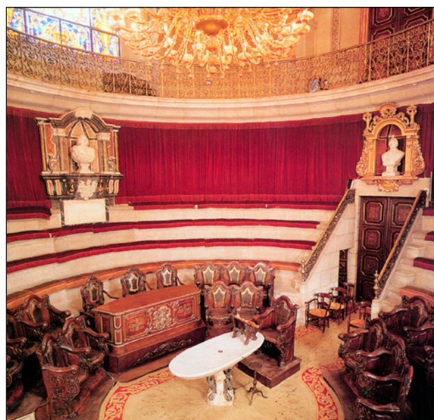
Figura 1. Sala de disección del Real Colegio de Cirugía de Barcelona.

La enseñanza comprendía tanto docencia teórica como prácticas clínicas. La primera de ellas englobaba ciencias tales como anatomía en sus distintas variedades tanto patológica como quirúrgica, descriptiva, fisiológica o práctica; la química en su vertiente neumática así como la denominada de contagio ; y la física experimental (5). Para ello se llevaban a cabo disecciones en las instalaciones del colegio como se aprecia en la figura 1 (Fig. 1).